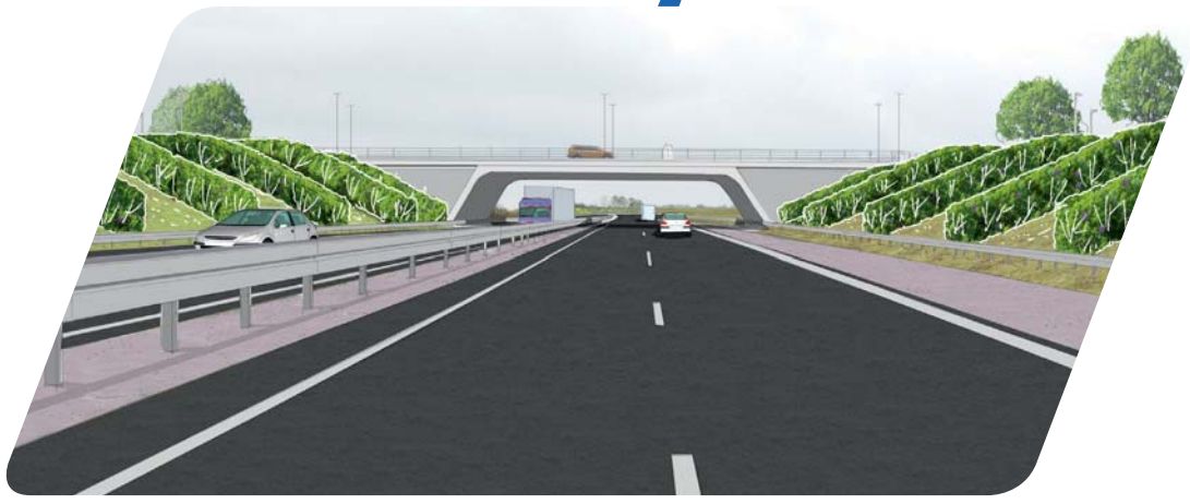
Tilslutningsanlægget som forbinder Hørtoftevej med M51, vil blive anlagt som en stor fordelering. Dette betyder at 3 overføringer over motorvejen er nødvendige. 2 til almindelig trafik og 1 til cykeltrafik.