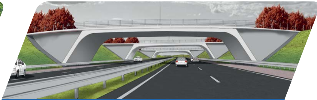
Alle overføringerne på motorvejs strækningen, undtagen tilslutningen ved E45, vil blive udført som rammebroer. Dette betyder at den "normale" midtersøjle, som ses på traditionelle danske motorvejsbroer, undgås.