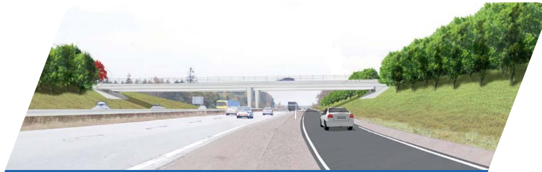
Ved anlæggelsen af M51-Kliplev Sønderborg Motorvejen, vil der blive udført 7 tilslutningsanlæg. Tilslutningsanlægget som forbinder M51 med E45, vil blive udført med en to-fags-bro.